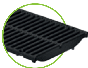
Liveno gvozdена rebrasta rešetka SW 18/215, klasa E šrafljenje sa 4 šrafa