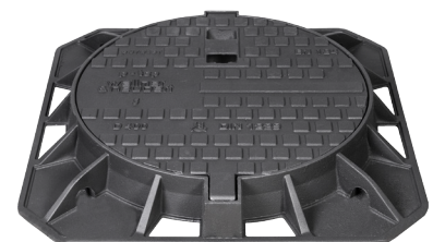
P-TOP Strong sa pravougaonim ramom (Art. br. P12400D)

Poklopac šahta DN 600, proizveden i testiran u skladu sa ON/EN 124 i DIN 1229, UA sertifikat, za svestranu upotrebu pogodan za sve klase opterećenja do F900. Poklopac i ram od nodularnog liva sa uloškom od elastomera i dvostrukom oprugom za zaključavanje integrisanom u poklopac sa sigurnosnim šarkama – blokira se na 80° pri zatvaranju, fiksira se u otvorenoj poziciji na 100°; element za centriranje poklopca; poklopac zamjenjiv, sa osloncima za korpe za mulj; Za dimenzije i težine pogledajte tabelu. Opciono: klase E600/F900; sa ventilacijom; Betonski okvir; Poklopac okrugao sa pravougaonim ramom.