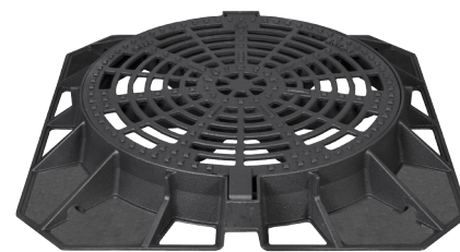
DRAINEX® L DN 600 sa pravougaonim ramom (Art. br. P32400DL)

Okrugla usisna rešetka, DN 600, proizveden i testiran u skladu sa ON / EN 124 i DIN 1229, UA sertifikat, klase opterećenja do C250/D400; Poklopac i ram od nodularnog liva sa integrisanim uloškom od elastomera i dvostrukom oprugom za zaključavanje integrisanom u poklopac; automatsko zaključavanje; sa sigurnosnim šarkom – blokira se na 80° pri zatvaranju, fiksira se u otvorenoj poziciji na 100°; element za centriranje poklopca; poklopac zamenljiv; Za dimenzije i težine pogledajte tabelu; Opcionalno: Sa pravougaonim ramom, sa okruglim ramom sa betonskom podlogom.